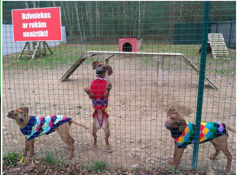
Här är tre av de valpar som räddades från en oseriös uppfödare.

En än gång ett stort tack för allt ert stöd !