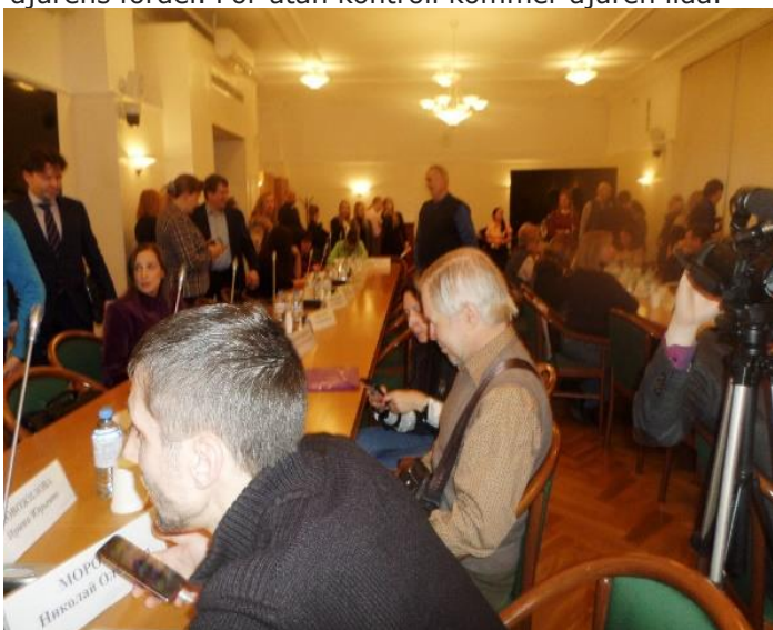
Djurvänner på möte i Duma (underhuset i ryska parlamentet)