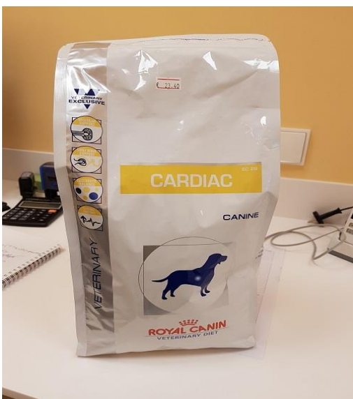
Specialfoder till Fuga