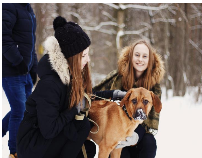
Volontärer går ut med hundarna i skogen varje dag.