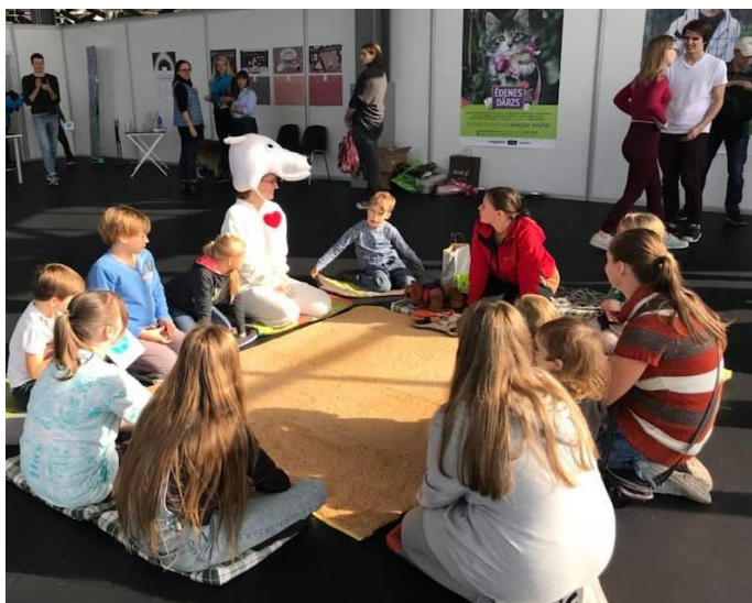
En stor del av arbetet består av utbildning av nästa generation.

Astrida hälsar och tackar för allt stöd som ni faddrar ger, det är en ovärderlig hjälp för djurskyddsarbetet i Lettland.