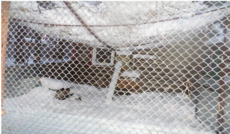
Katternas inhägnad. Det är så mycket snö där nu, men katterna vill gå ut trots snön ☺