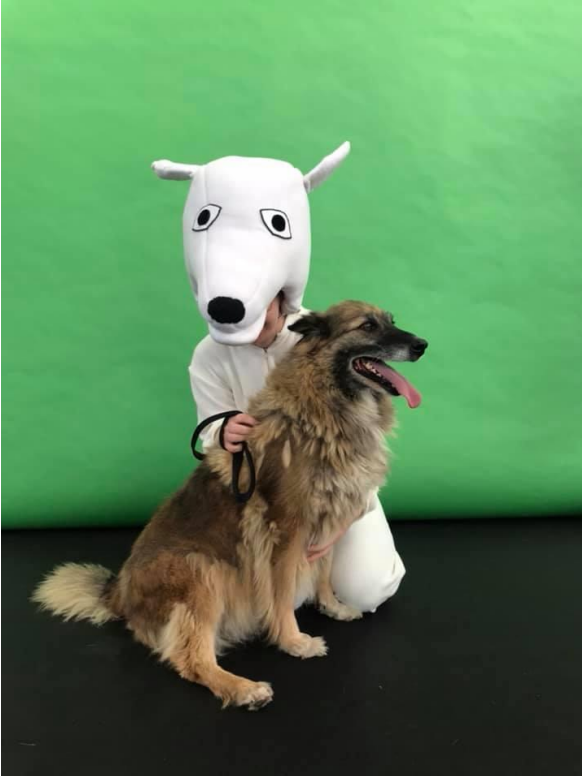
Robin är det lettiska djurhemmets egen maskot.